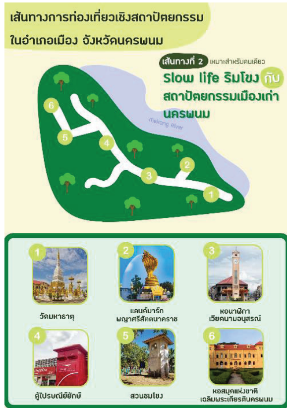
ภาพประกอบ 2 เส้นทางท่องเที่ยว Slow life ริมน้ำโขงกับสถาปัตยกรรมเมืองเก่านครพนม (กลุ่มนักท่องเที่ยวแบบคนเดียว)

เส้นทางที่ 3 เส้นทางท่องเที่ยว Back to the past in Nakhon Phanom City (กลุ่มเพื่อน/คู่รัก) โดยคณะผู้วิจัยได้เลือกประเภทสถานที่ท่องเที่ยวเชิงสถาปัตยกรรมให้เหมาะสมกับพฤติกรรมของนักท่องเที่ยวกลุ่มเพื่อน/คู่รัก โดยมีสถานที่ท่องเที่ยวดังนี้ 1) พิพิธภัณฑ์ปลาลุ่มน้ำโขง เป็นสถานที่จัดแสดงพันธุ์ปลาน้ำจืดที่อาศัยอยู่ในแม่น้ำโขง และแม่น้ำในจังหวัดนครพนม ทั้งสายพันธุ์ที่พบได้ทั่วไปและสายพันธุ์ที่หายาก โดยไฮไลท์ของที่นี้อยู่ที่อุโมงค์จำลองโลกใต้น้ำที่สามารถชมปลามากมายแหวกว่ายไปมาผ่านกระจกบริเวณผนังและเพดานของ